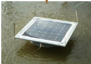
ソーラー水浄化装置